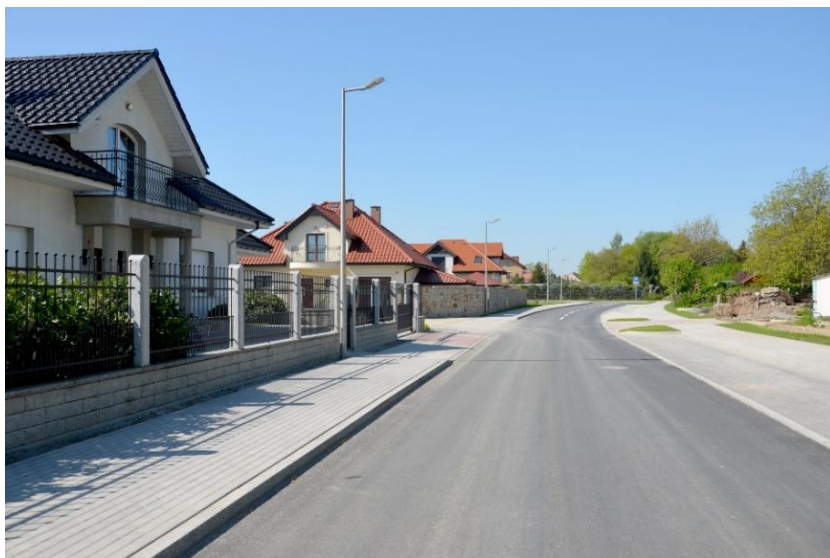
Fot. 20 – Nowa droga gminna – ul. Wodna w Strzegomiu