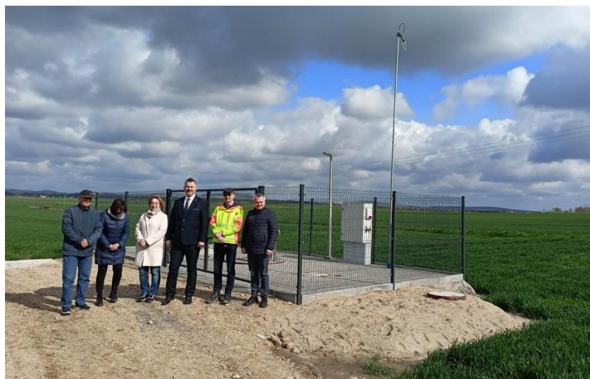
Fot. 22 – Kanalizacja Skarżyc i Grochotowa