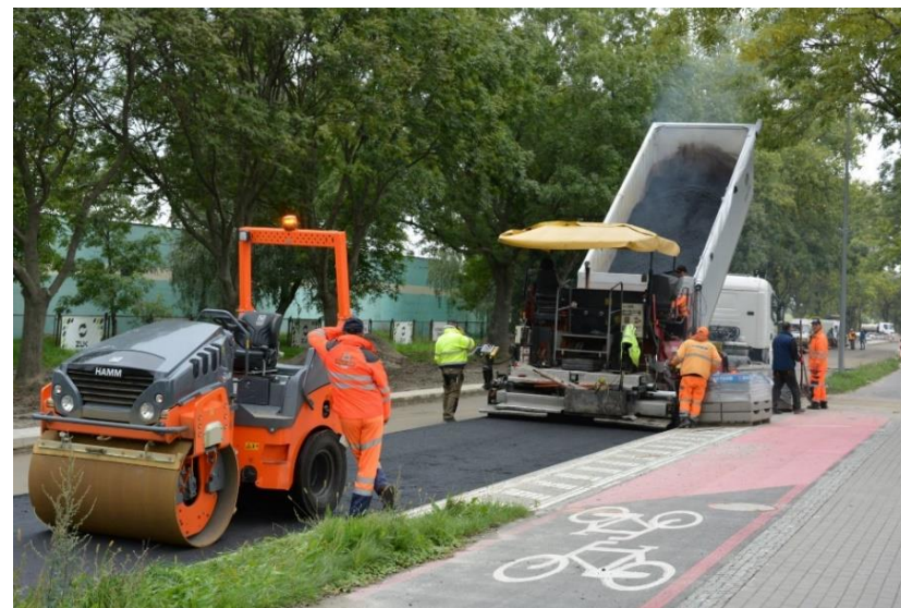
Fot. 19 – Finał przebudowy al. Wojska Polskiego w Strzegomiu (etap I)