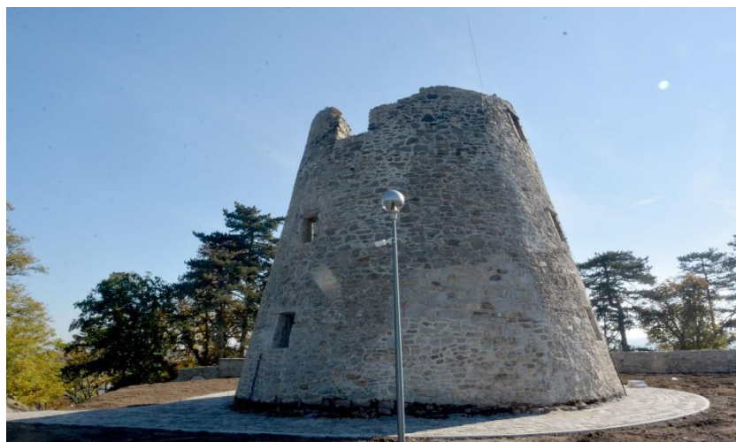
Fot. 4 – Wiatrak prochowy po wykonaniu I etapu robót