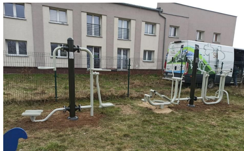
Fot. 11 – Nowy sprzęt rekreacyjny na osiedlu Hotele w Jarosławie