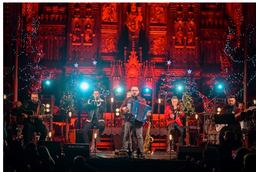
Fot. 17 – Świąteczny koncert zespołu ENEJ w strzegomskiej bazylice