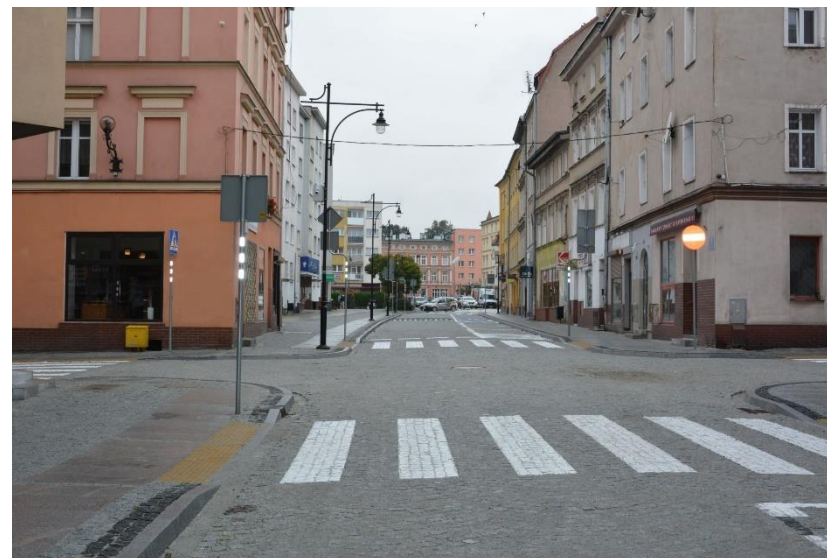
Fot. 21 – Przebudowana ul. Dąbrowskiego w Strzegomiu