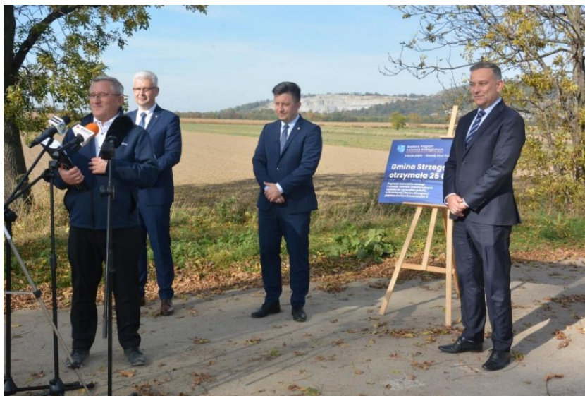
Fot. 18 – Historyczne dofinansowanie na budowę obwodnicy Granicznej