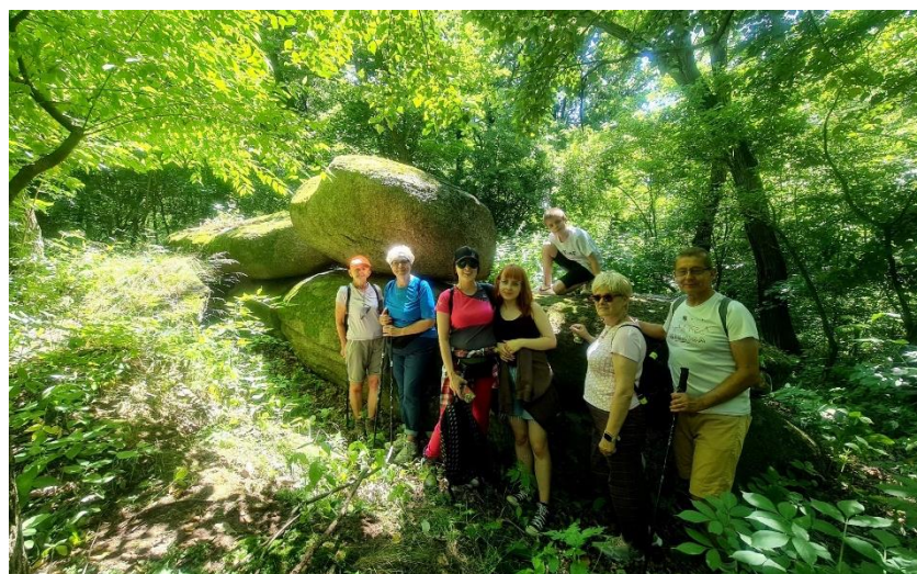
Fot. 6 – Jedna z rodzinnych wycieczek z przewodnikiem