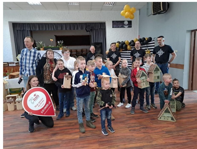
Fot. 9 – Przekazanie domków dla ptaków i owadów mieszkańcom Goczałkowa