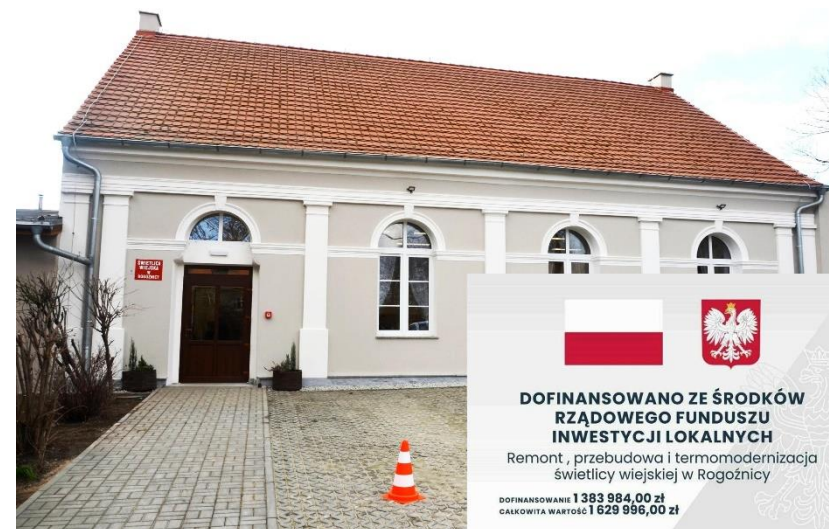
Fot. 23 – Świetlica wiejska w Rogoźnicy po przebudowie