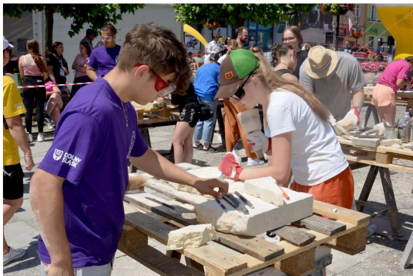
Fot. 2 – Warsztaty kamieniarskie dla młodzieży podczas SGŚ 2022