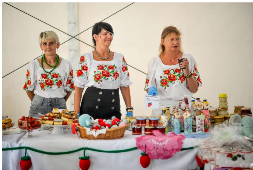
Fot. 8 – Święto Truskawki 2022