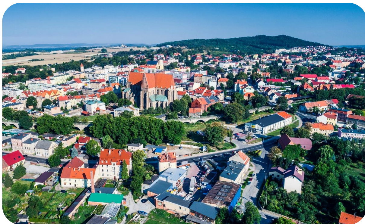
Fot. 1 – Panorama Strzegomia