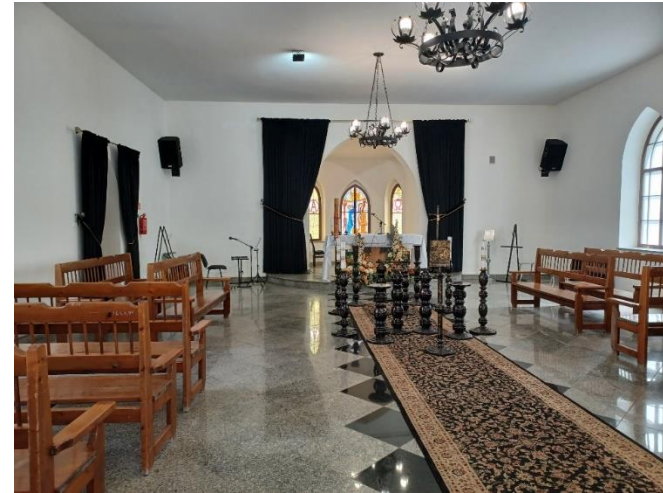
Fot. 25 – Odnowiona kaplica cmentarna przy ul. Olszowej w Strzegomiu