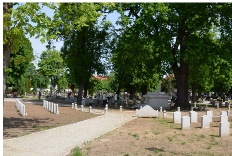
Fot. 5 – Odrestaurowana kwatera żołnierzy poległych w czasie I wojny światowej