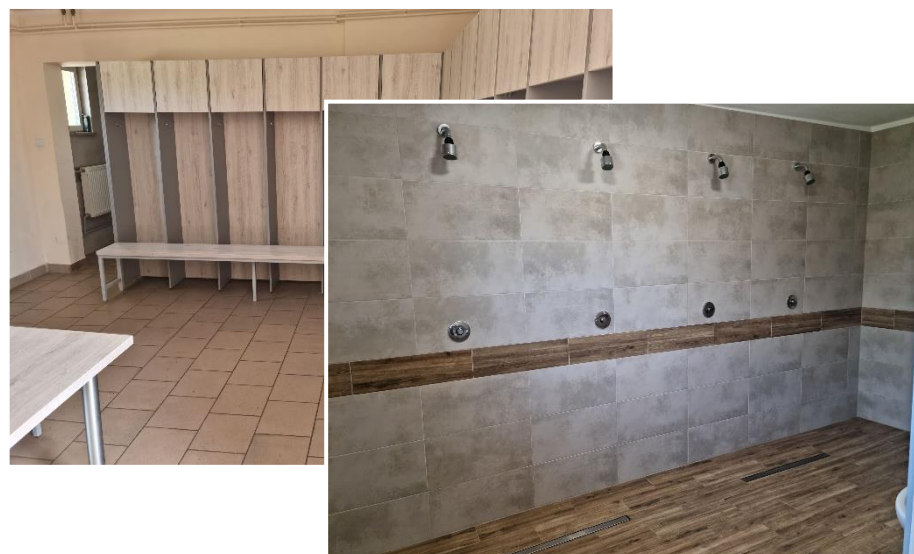
Fot. 13 – Nowa szatnia dla strzegomskich sportowców