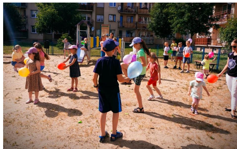
Fot. 7 – Letni piknik rodzinny w Strzegomiu