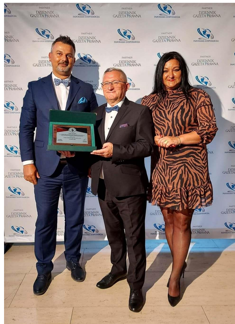
Fot. 3 – Nagroda „Lider Gospodarki Regionalnej w roku 2022”