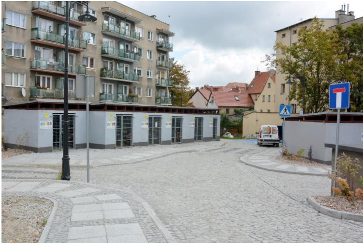
Fot. 24 – Kolejne przestrzenie międzyblokowe po modernizacji