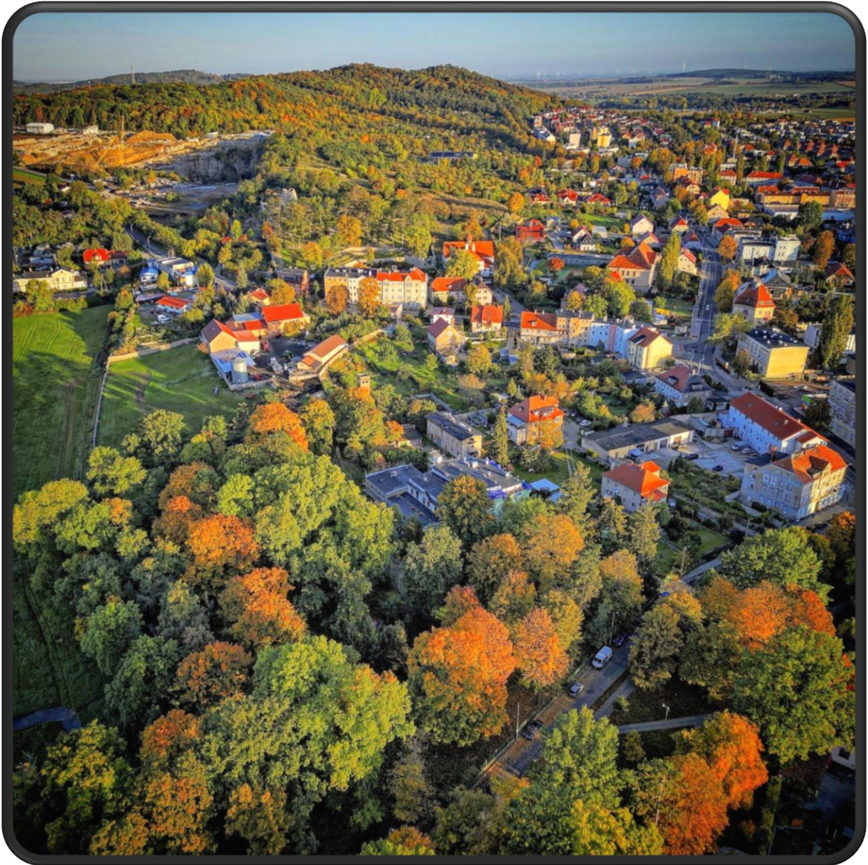
Fot. 26 – Panorama Strzegomia (autor: Tomasz Smagłowski)