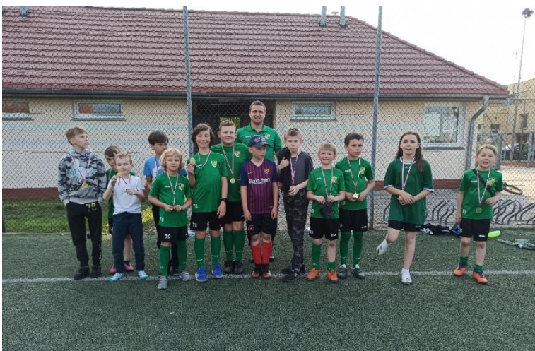
Fot. 14 – Uczestnicy zajęć sportowych na jaroszowskim boisku ORLIK