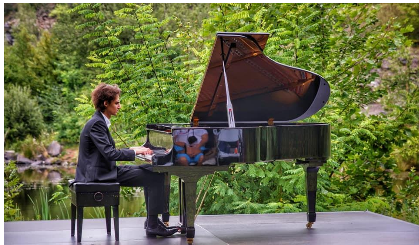
Fot. 16 – Koncert plenerowy w byłym kamieniołomie