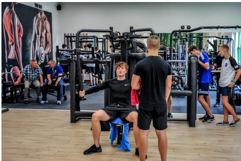
Fot. 12 – Przebudowana siłownia OSiR