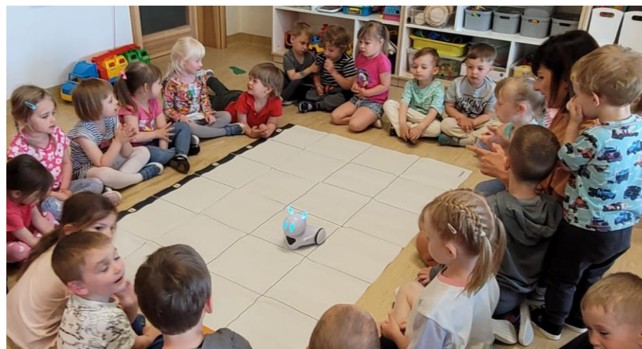
Fot. 15 – Zajęcia z wykorzystaniem robota PHOTON EDU